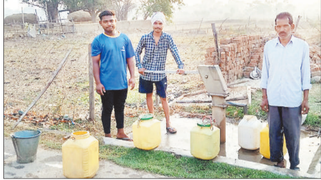
हैडपंप से पानी भरने पहुंचे वार्ड के लोग।

जानकारी के अनुसार उक्त कार्य समय-समय में पूरा करने के निर्देश दिए गए थे, लेकिन समय-समय समाप्त होने के बाद भी कार्य पूरा नहीं कराया गया, जिसका परिणाम यह है कि आज भीषण गर्मी में नगर पालिका क्षेत्र के कई वार्डों में पेयजल की समस्या बनी हुई है, जिसे लेकर लोगों की परेशानी प्रतिदिन बनी रहती है। यदि करोड़ों के जलावर्धन योजना को समय-समय में पूरा करा