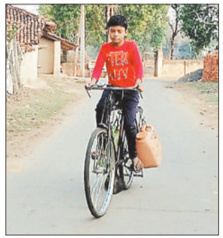
सायकल से पानी ले जाते वार्ड के रहवासी।

लिया गया होता तो गर्मी के दिनों में लोगों को पेयजल के लिए परेशान नहीं होना पड़ता। गर्मी शुरू होने के साथ ही नपा क्षेत्र के कई वार्डों में पेयजल संकट शुरू हो जाती है, लेकिन नगर पालिका प्रशासन द्वारा पेयजल संकट प्रस्त वार्डों में नियमित रूप से पर्याप्त मात्रा में टैंकर