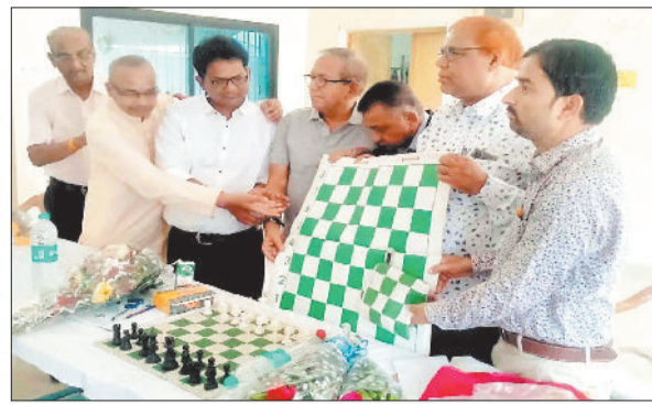
जिला संघ को मैनेजिकल डेमो चेंस बोर्ड देते पदाधिकारी।