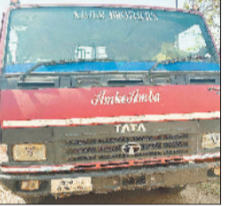
पटना) में अभिरक्षार्थ रखा गया। इसी तारतम्य में तहसील बैकुंठपुर क्षेत्र का आकस्मिक निरीक्षण 11 मई 2024 को किया गया। इसमें अवैध परिवहनकर्ताओं के विरुद्ध निरंतर कार्रवाई करते हुए खनिज कोयला के एक वाहन क्रमांक यूपी 64 एटी 1904 को समीपस्थ थाना चरचा में अभिरक्षार्थ रखा गया। इस तरह अवैध परिवहन के कुल तीन प्रकरण दर्ज कर उक्त

बैकुंठपुर। कलेक्टर विनय कुमार लॉंग के निर्देश पर खनिज अधिकारी एवं खनिज अमला द्वारा खनिजों के अवैध उ त र ख न न क र्ता - परिवहनकर्ताओं के कार्रवाई विरुद्ध निरंतर कार्रवाई किया जा रहा है। इसी तारतम्य में खनिज अमला द्वारा बैकुंठपुर तहसील एवं पटना क्षेत्र का आकस्मिक निरीक्षण किया गया। इसमें अवैध परिवहनकर्ताओं पर कार्रवाई करते हुए खनिज गिट्टी के दो वाहन क्रमांक सीजी 15 ईसी 7308 एवं सीजी 16 सीएम 1428 को समीपस्थ थाना (बैकुंठपुर,